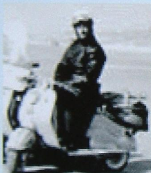
Aalborg LAMBRETTA KLUB Foreningsarkiv